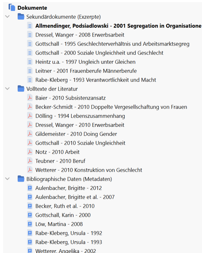
Abbildung 1. Projekt aufgesetzt: eBooks und ePaper (PDF), Exzerpte (RTF), bibliografische Daten (RIS).

Wie? Nutzen Sie die „Dokumentgruppen“ zur Differenzierung verschiedener Arten von Daten, falls Sie die Gruppen nicht zur Differenzierung anderer (z.B. inhaltlicher) Aspekte eingeplant haben.